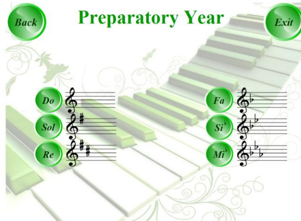
شكل رقم ٢

عن طريق ابتكار برنامج باستخدام الكمبيوتر صمم خصيصا لتدريس ودراسة السلالم الموسيقية لآلة البيانو بالكلية حتي يستطيع كل معلم ومتعلم استخدامه بسهولة في عملية تدريس السلالم الموسيقية في جميع المراحل الدراسية بالكلية ومن هنا قامت الباحثة ببرمجة السلالم الموسيقية بجميع متطلباتها في جميع المناهج من الفرقه الإعدادية لمرحلة البكالوريوس بالكلية .