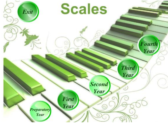
شكل رقم ٣ برنامج السلالم